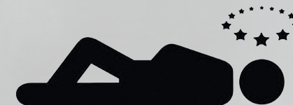
загуба на съзнание LOSS OF CONSCIOUSNESS